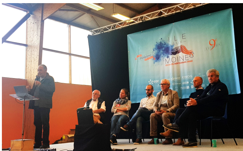
Table ronde - Festival des Insulaires - 24 septembre 2022 - Île-aux-Moines

Pour la 9ème édition du festival des Insulaires , direction l'île-aux-Moines.